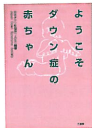
『ようこそダウン症の 赤ちゃん』 (日本ダウン症協会編著・ 三省堂発行・256ページ・ 1,400円+税)