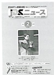
『JDSニュース』 (月刊・B5サイズ・モノク ロ・24ページ・300円)

乳幼児から成人までダウン症に関する充実した内容の会報『JDSニュース』を毎月発行。長い間蓄積してきた知識・情報を独自の視点でまとめた冊子「ダウン症miniブック」もシリーズで発行(6ページ参照)。また、ホームページやマスコミ等を通じて、ダウン症に関する各種の情報を発信しています。