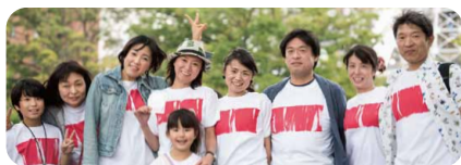
人と人をつなぐ一本の線が描かれた、シンプルでおしゃれなTシャツです。 produced by equaliō

※「つながるTシャツ」は、障がいを持ちながら就労継続支援事業所で働く人たちの手で作られています。赤いラインは手作業のため、一つとして同じものはありません。